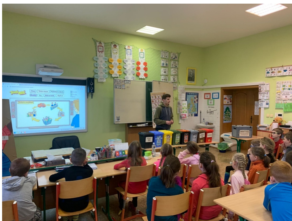
Téma recyklace děti velmi zaujalo.